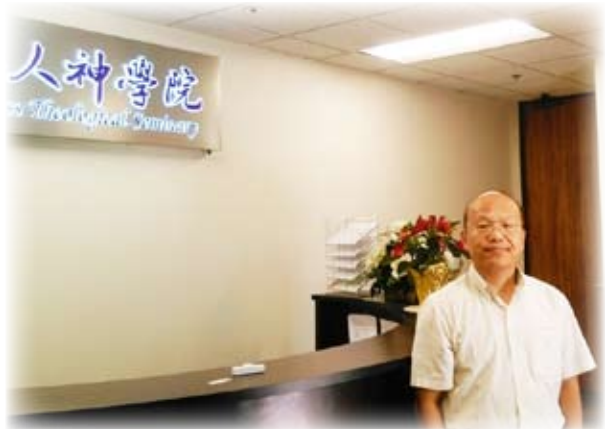
▲ 2018.6.21 拜訪舊金山基督工人神學院