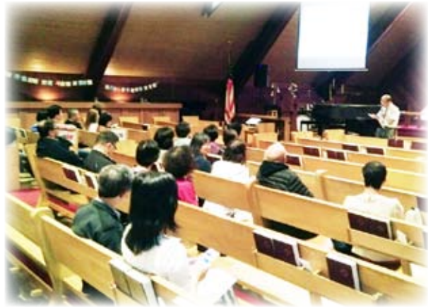
▲ 2018.6.23 在舊金山路 德會恩旺堂主講神學講座