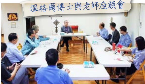
溫格爾博士與老師座談會