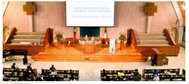
改教五百週年APELT講座