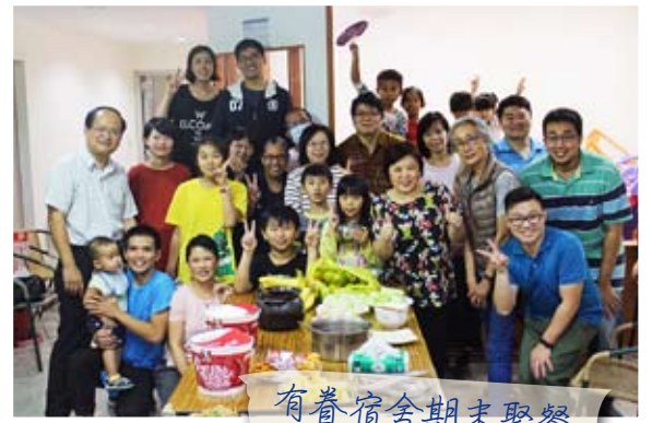
有眷宿舍期末聚餐