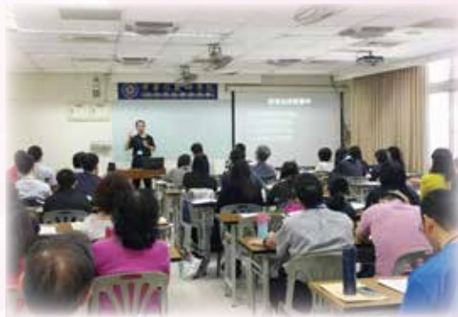
感謝主！4/28-4/29 神學營共有65位學員