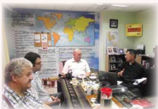
05/05 德國馬堡差會主管來訪