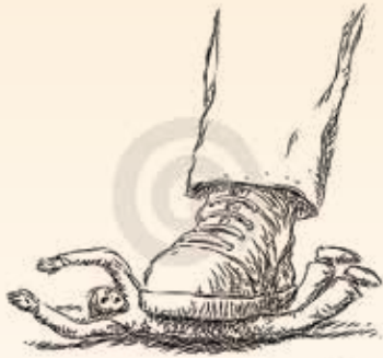
神說：對國內的外籍人和孤兒寡婦使公義彎曲的國必受咒詛

申命記二十四14「困苦窮乏的雇工，無論是你的弟兄或是在你城裡寄居的，你不可欺負他。」15「要當日給他工價，不可等到日落—因為他窮苦，把心放在工價上一恐怕他因你求告耶和華，罪便歸你了。」