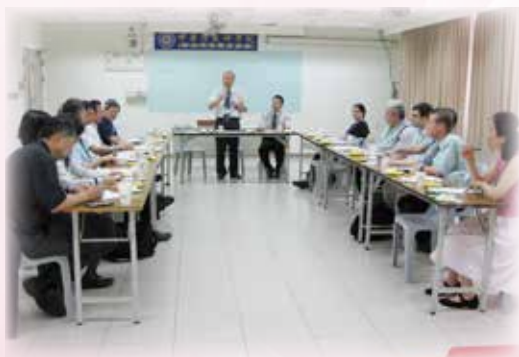
05/05 舉行教會機構實習牧長座談會