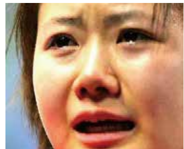
主需要祂百姓關心在台灣身處很多苦難中的外籍人士

利未記十九33「若有外人在你們國中和你同居，就不可欺負他。」34「和你們同居的外人，你們要看他如本地人一樣，並要愛他如己，因為你們在埃及地也作過寄居的。我是耶和華——你們的神。」