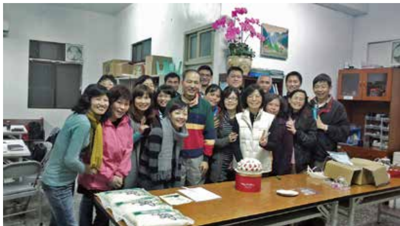
「舊約人物」課程：老師及修課同學團體照