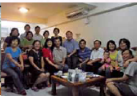
桃園區校友聯誼會