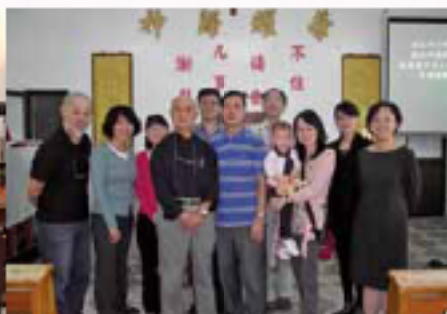
竹苗區校友聯誼會