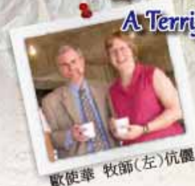
歐使華 牧師(左)伉儷