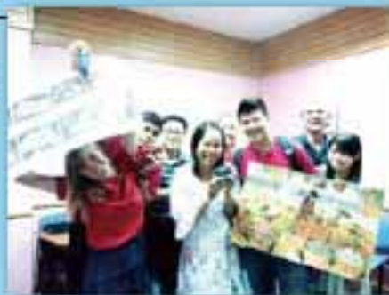
一起學泰文的同學