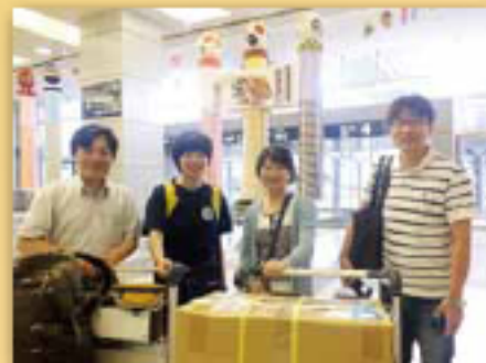
帶著米粉抵達仙台機場