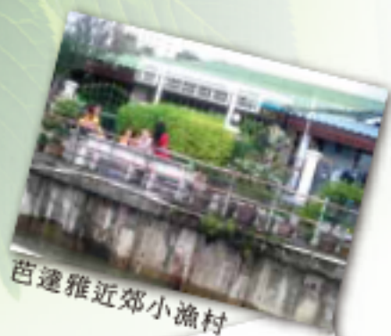
芭達雅近郊小漁村

跨文化宣教的兩個門檻就是語言和文化，而生活應該就是這兩者的總和吧。要學會他們習慣的用語、關心的話題、幽默的方式、禁忌的行為等，這些是課堂上不會教，也沒辦法教的必修課程，只有貼近泰國人的生活中，在市場裡、在電車上、在閒聊中用心體會才學得到的。宣教應該就是學習耶穌道成肉身的榜樣，最實際的操練吧！我需要、也想學。