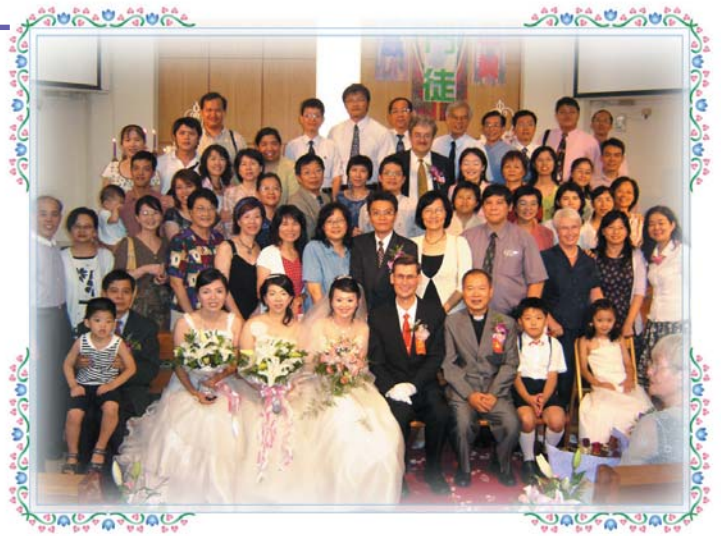
↑ 信神大家庭齊聚歐祈人牧師婚禮為新人祝福