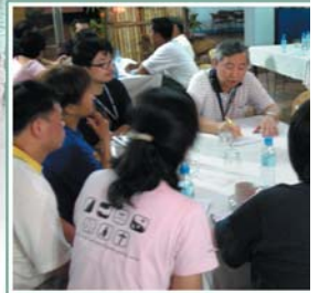
↑ 翁院長帶領行前會議