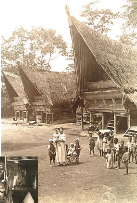
→ 巴塔克人的村落 ↓ 巴塔克人崇拜各種鬼祇諸靈