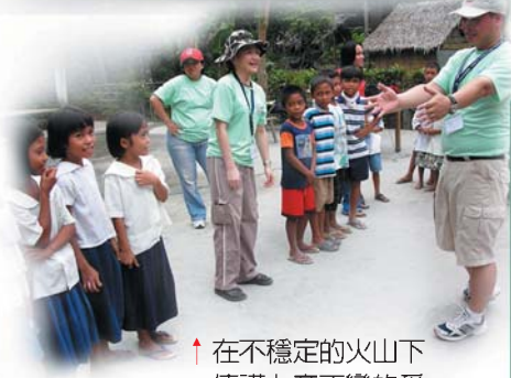
↑ 在不穩定的火山下傳講上帝不變的愛