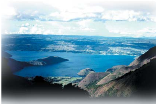
↑ 巴塔克族的宗教聖地 Toba 湖