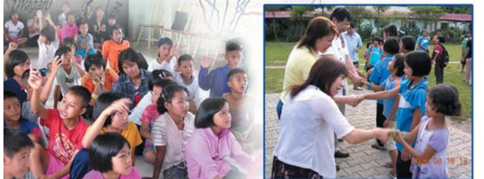
← ↑ 訪視恩慈育幼院