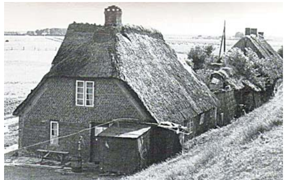
↑ 諾門生出生於北歐小島Nordstrand

諾門生於1834年6月2日生於北海（北歐）小島Nordstrand。同一天，兩位向巴塔克族傳福音的宣教士被巴塔克人殺害並吃掉。