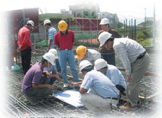
↑ 市政府督察大樓施工

A： 我一直覺得上帝是很幽默的，祂的時間我無法知道；這段時間是我沉潛放空的時候，需等待神要給我的計劃。現在我