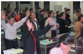
↑ 為期五天的門徒訓練營