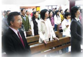
↑ 葉高芳牧師教授密集課程