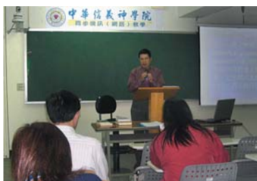
↑ 同步遠距視訊教室已正式啓用