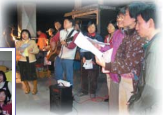
↑ 大埤夜市唱詩發單張 ← 兒主的福音成果